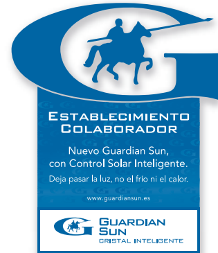
Pegatina establecimiento colaborador