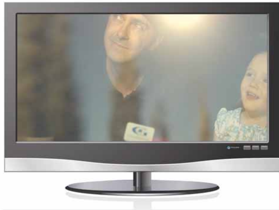
Campaña de TV.

Así, sus clientes sabrán que allí encontrarán el mejor cristal del mercado para sus ventanas.